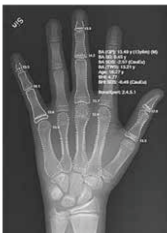
圖1. 手的X-ray，電腦的人工智慧（AI）自己算出骨骼歲數（bone age）來自Wikipedia： https://en.wikipedia.org/wiki/Artificial_intelligence

這簡稱Paige.AI初創公司全名是Pathology AI Guidance Engine 11 ，創設的目標是要把人工智慧（Artificial Intelligence; AI）應用到癌症的診治上。先來說Paige字義，P是pathology；ai/AI= artificial intelligence；g=guidance；e=engine。這公司的三位創辦人跟Memorial Sloan Kettering癌症中心有密切關係，還有另外三位MSK董事投資。去年（2018）2月公司獲得2千5百萬美金（25 million）的投資時，當時的媒體，尤其商界/生醫界不少報導，大都是正面而沒有負面的報導，期望公司會成功地把人工智慧應用到醫學