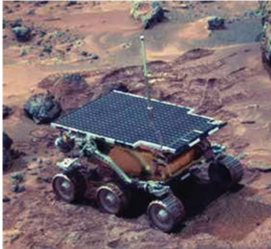
圖3. 美國第一代的Mars Rover